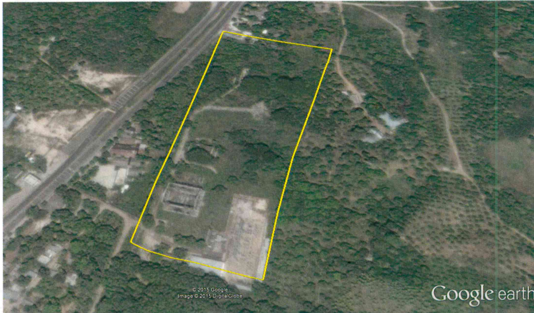
Localización subestación Río Córdoba 220kV