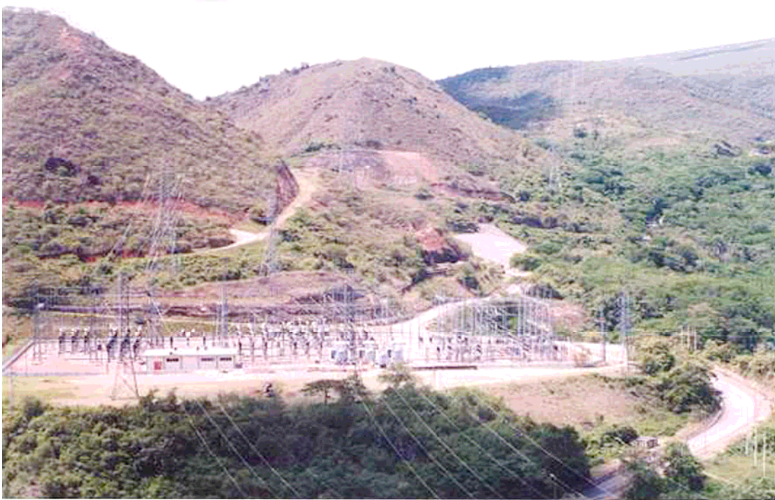
Foto N° 7 (S/E Betania). Desde costado oriental. Vista subestación. Parte posterior salida de circuitos hacia San Bernardino y Mirolindo. Parte central salida circuito hacia El Bote y costado derecho salida del circuito hacia Altamira. Al lado derecho de la casa de controles está el acceso y el espacio disponible en el patio de 230 kV.