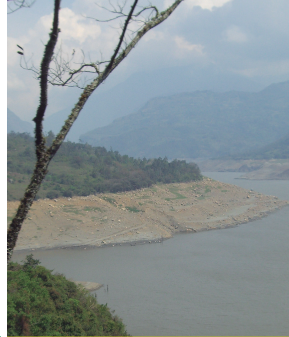
Chivor embalse Esmeralda