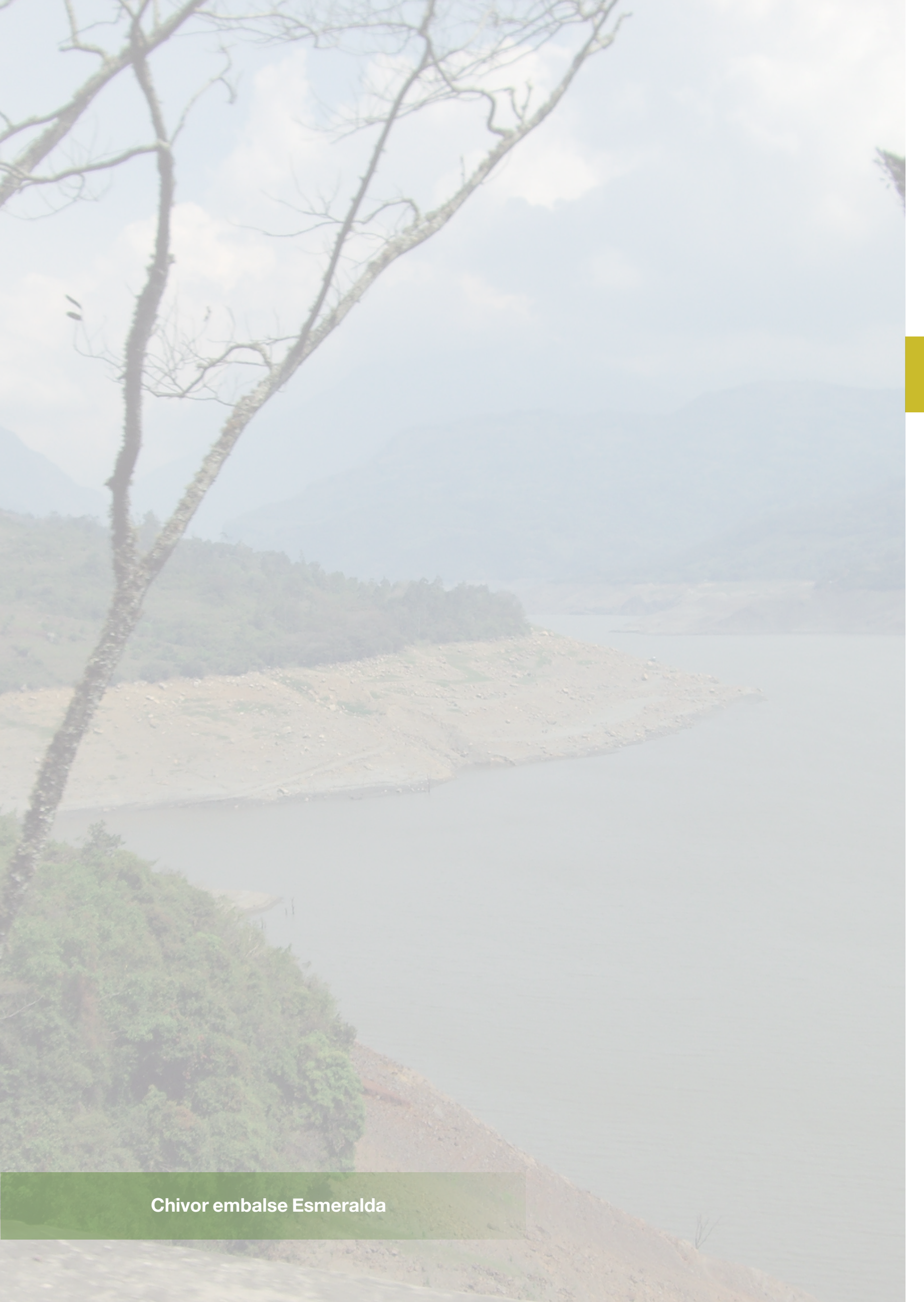
Chivor embalse Esmeralda