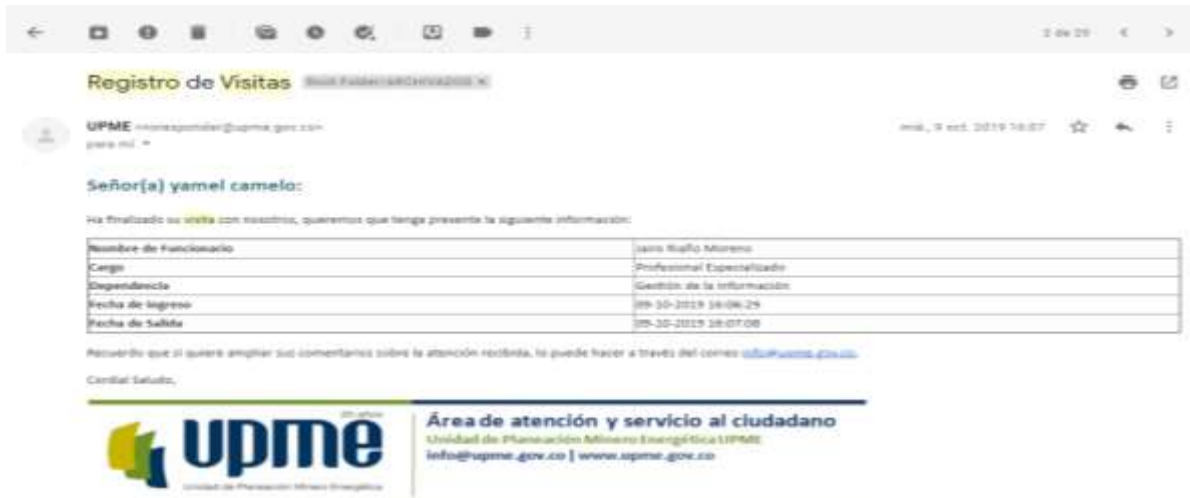
Fuente: Informes módulo de gestión de visitas UPME 2020 (Imagen No. 1)

A continuación se muestra una figura que ilustra las características con las cuales llega la certificación.