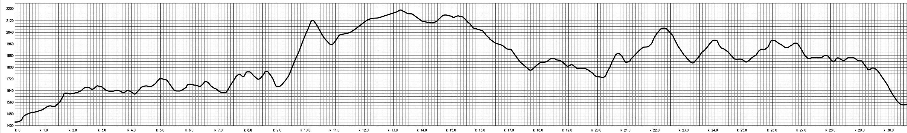
Alternativa 1 - BELLO - GUAYABAL, 230 kV